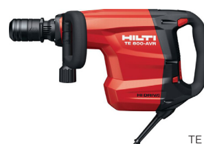
Hilti TE 800-AVR