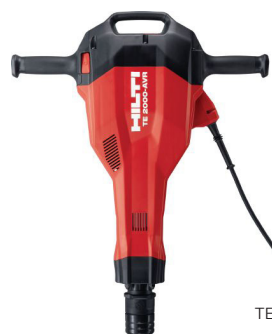
Hilti TE 2000-AVR