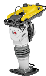
Wacker BS 60-2 plus