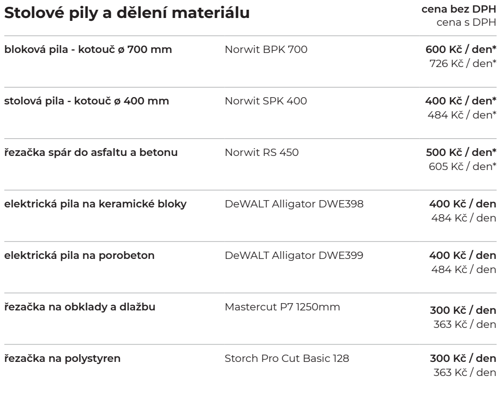
Norwit BPK 700