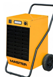
Master DH 62

Podmínky půjčování, podrobnější informace o nářadí a nabídce příslušenství si můžete prohlédnout na www.stavebniny-vm.cz/pujcovna/ .