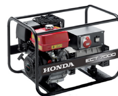
Honda ECT 7000