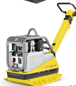
Wacker DPU 5545 Heh