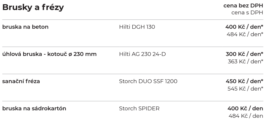
Hilti DGH 130