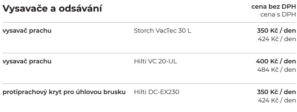
Storch VacTec 30 L

* uvedené ceny půjčovního nezahrnují sekáče, vrtáky, řezné a brusné kotouče nabídka příslušenství na www.stavebniny-vm.cz/pujcovna/